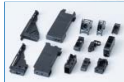
センサー関連精密成形品