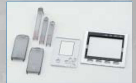
外装部品、印刷加工部品