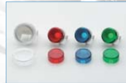
アミューズメント関連精密成形品