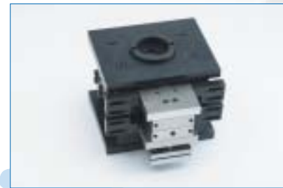
Mold Station System