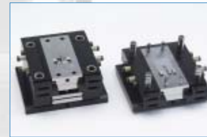
Mold Station System